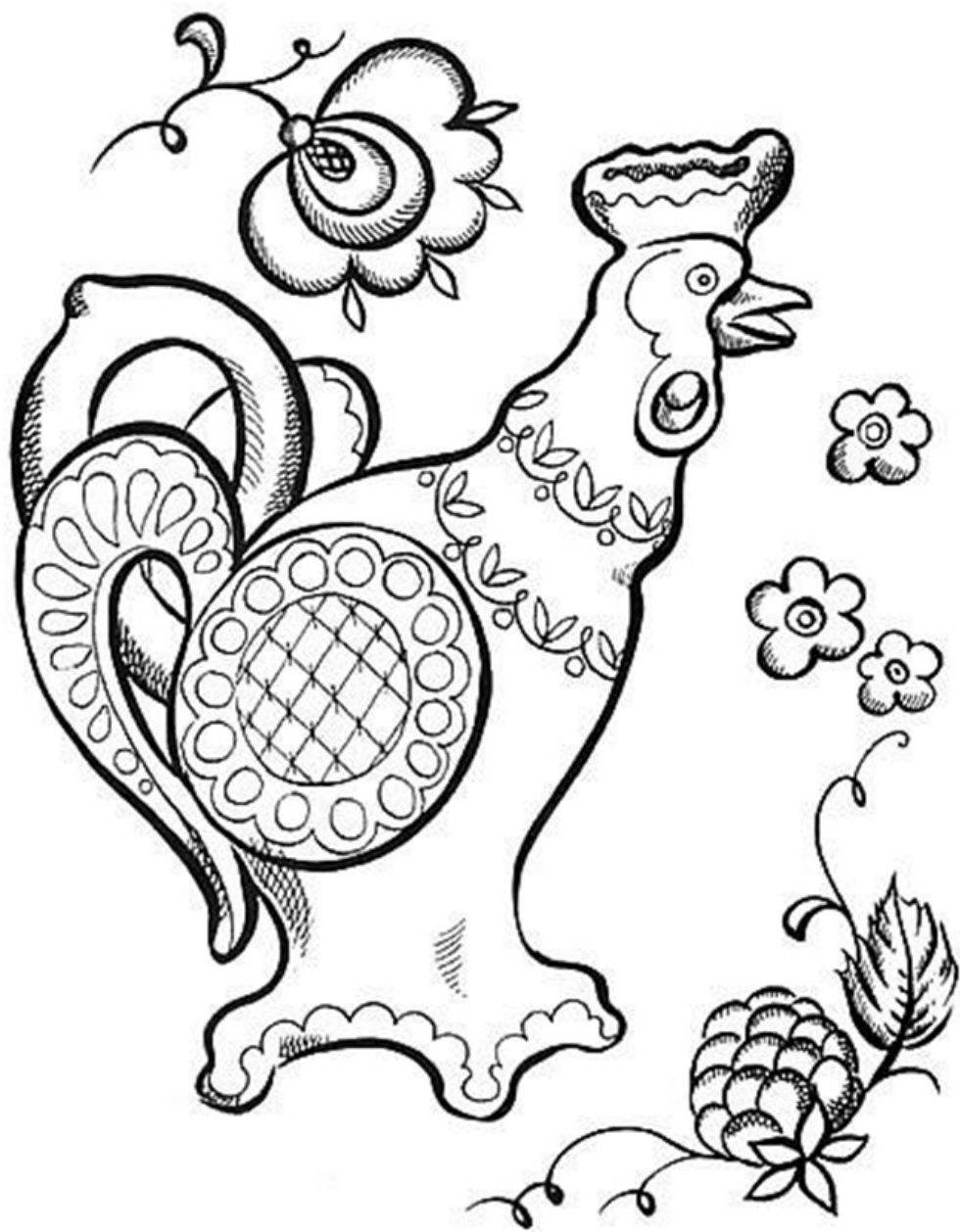
8 Большое внимание уделяется форме изделия.