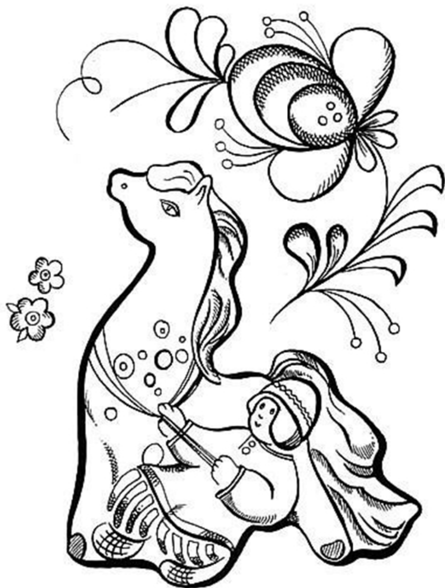
Назначение его порой отодвигается на второй план. Сказка соединяется с вещью.