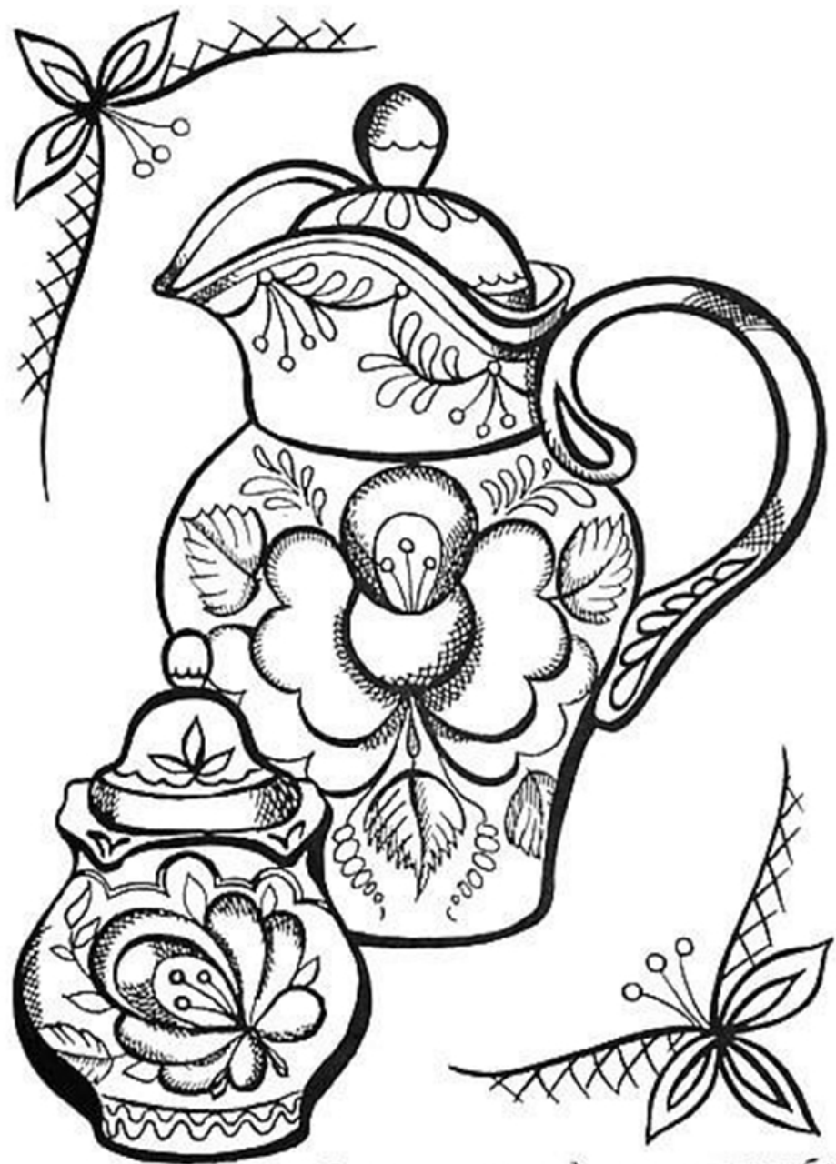
10 Гжельская посуда очень разнообразна. Она поражает изяществом форм, тонкостью росписи.