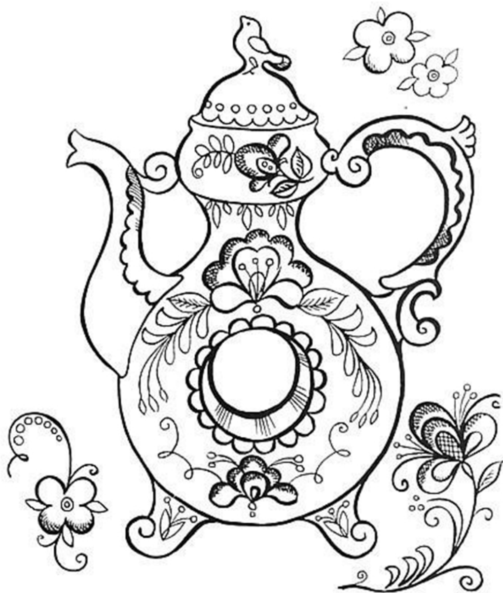
Особой пластической выразительностью отличаются дисковидные сосуды - Квасники.